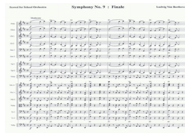
Himne: Novena simfonia de Beethoven.

Sabiem que tot i que molts l'aproven, el canvi resultaria difícil i vam decidir introduir-lo sense presses. Així que, en els primers partits, cadascú va aportar alguna cosa d'ell mateix, una tàctica pròpia i la seguïem. La gent, a poc a poc, s'adonava de la nostra estabilitat i de les millores introduïdes en el joc. El canvi va suposar grans avantatges encara que molts es van queixar del preu de les entrades, ja que eren molt cares; però, tot i així, van decidir recolzar-nos.