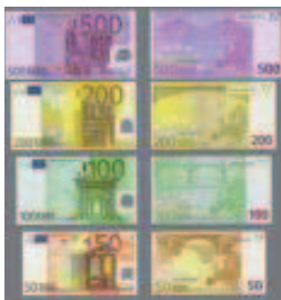
Bitllets en euros.