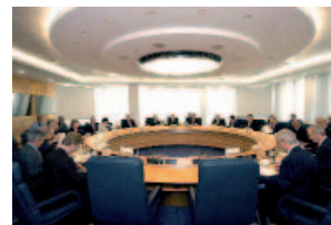
Seu del Banc Central Europeu (BCE). Frankfurt. Alemanya.

En canvi, Dracma sí que volia formar part de l'equip però, tot i els seus esforços, l'habilitat que tenia en el joc no era prou bona. Tenia problemes per regatejar, no encertava a l'hora de marcar gols i les passades que feia no eren precises. I a Coronsuec, li passà cosa semblant; no tenia la resistència física que es necessitava per ser d'un equip d'aquesta categoria (les nostres expectatives eren molt altes), només se lesionava... la veritat, un jugador bastant inestable. Unes vegades entrenava, d'altres es dormia... era bastant imprevisible i irregular.